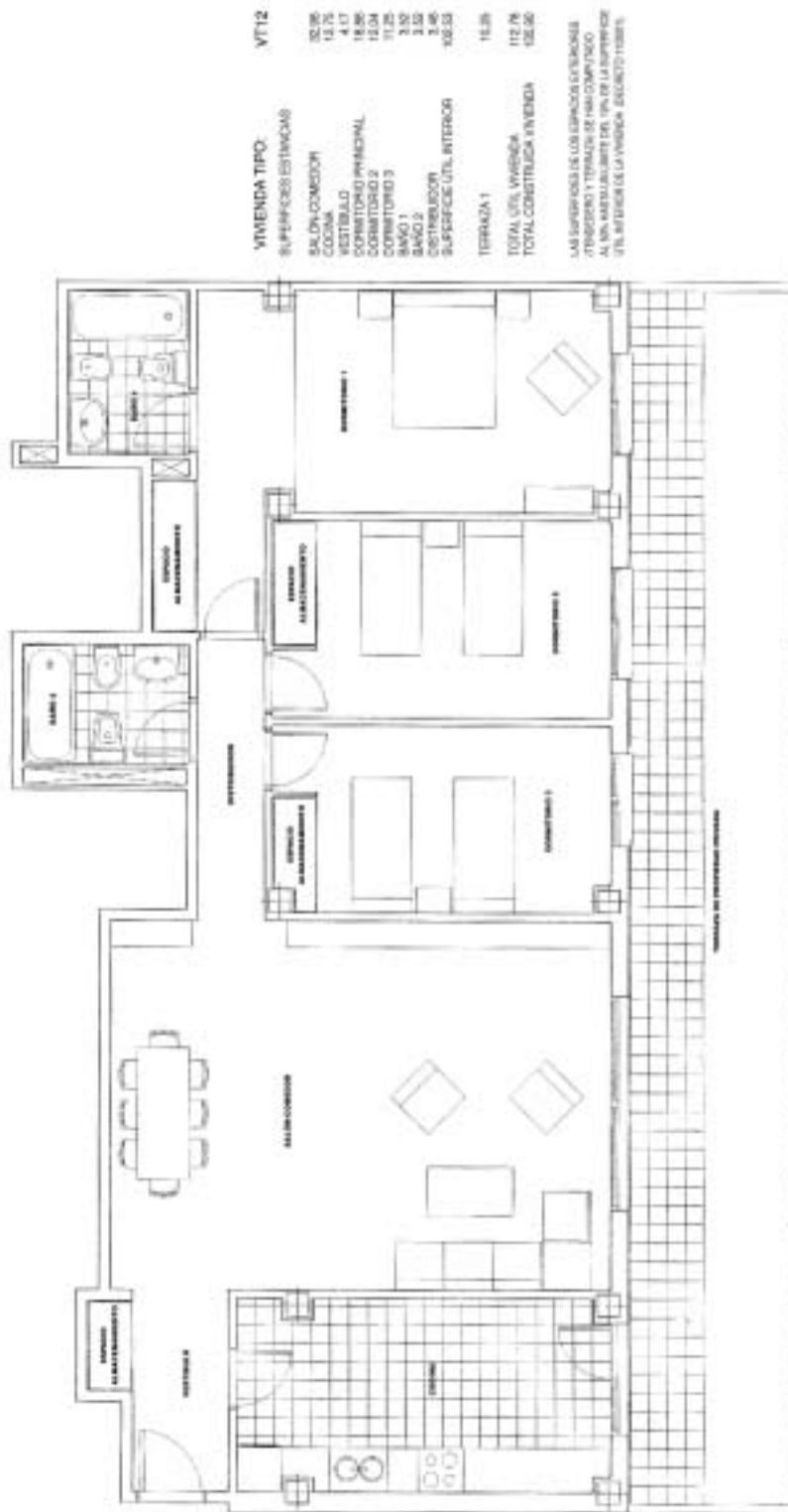
141 VIVIENDAS VPP, PLAZAS DE GARAJE Y TRASTEROS EN LA PARCELA RO-13 DEL ÁREA DE OPORTUNIDAD DE MAJADAHONDA